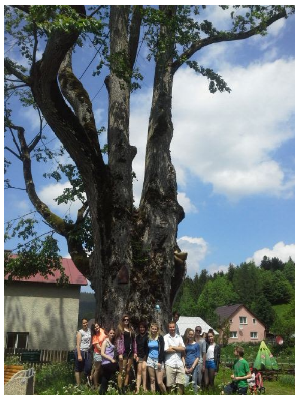
Obrázok 8 Brest hrabolistý

Je jeden z najmohutnejších príkladov brestu hrabolistého v strednej Európe. Rastie v hornej časti osady Papajovci, patriacej do katastrálneho územia obce Makov v časti Kopanice v blízkosti červenej turistickej značky vedúcej na hrebeň Javorníkov, smer Semeteš. Rastie v nadmorskej výške 720 m. Poprsný obvod kmeňa je 590 cm, pri koreňoch 1180 cm. Výška stromu je 30 m a odhadovaný vek 400 rokov, niektorí odhadujú vek až na 600 rokov, čo ho radí k najstaršiemu brestu hrabolistému v strednej Európe. Pri snehovej kalamite v decembri 2005 sa niekoľko konárov poškodilo. Na jar 2006 prebehlo ošetrovanie a vyváženie koruny tohto vzácného stromu.