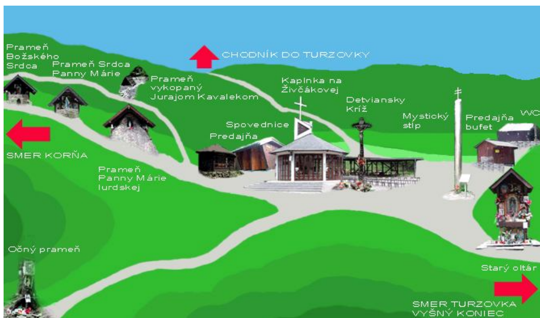
Obrázok 19 Pramene Zdroj: www.zivcakova.sk SOŠ poľnohospodárstva a služieb na vidieku v Žiline, 2015