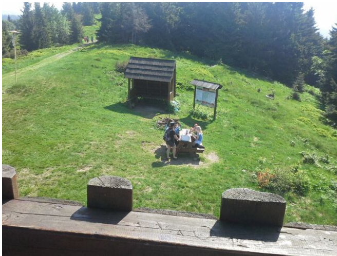
Obrázok 4 Z rozhľadne na Stratenci Zdroj: Vlastný zdroj