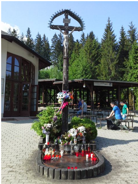
Obrázok 17 Detviasky kríž

Vrch Živčáková, ako súčasť Turzovskej vrchoviny, sa nachádza vzdušnou čiarou asi 3 km východne od mesta Turzovka. Vrchol má nadmorskú výšku 787,7 metrov. Areál pútnického miesta Živčákovej je rozprestretý na lesnej čistinke v starom smrekovom lese. Stretá sa tu viacero chodníkov z Turzovky, Korne, Vysokej, či Kelčova, aby sem priviedli všetkých tých, ktorí sem prišli hľadať, prosieť, či ďakovať. Je to miesto, kde sa vraj pred viac ako polstoročím (1958) zjavila Panna Mária. V blízkosti zjavenia sa nachádzajú „liečivé“ pramene. Na mieste zjavenia sa nachádza kaplnka Panny Márie Kráľovnej pokoja, kde sa počas roka konajú púte a bohoslužby. Kaplnka spadá pod farský úrad v obci Korňa. Skutočnou raritou miesta je detviasky kríž, ktorý Živčákovej venovali obyvatelia tejto rázovitej obce. Viac sa dozviete na www.zivcakova.sk GPS súradnice: N49°23'40.19", E18°34'36.34"