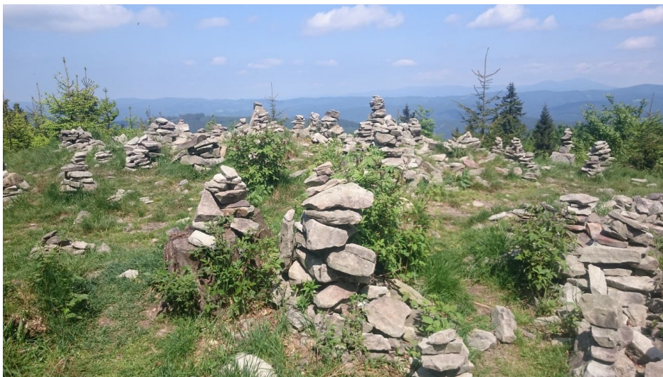
Obrázok 7 Na ceste z Veľkého Javorníka