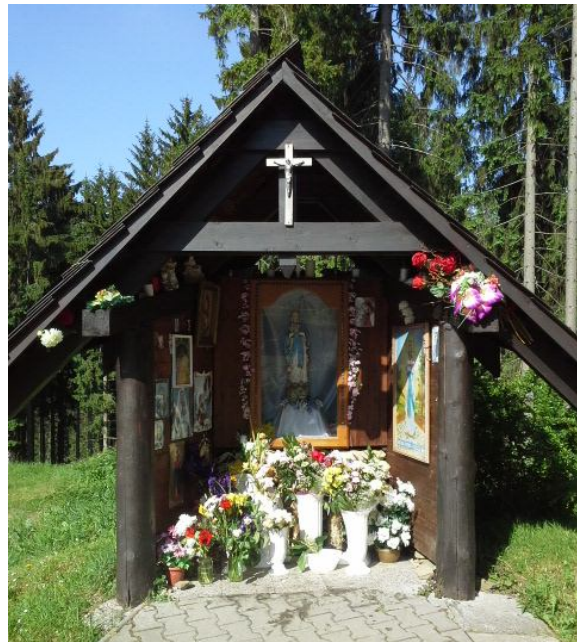
Obrázok 18 Jedna z kaplniek