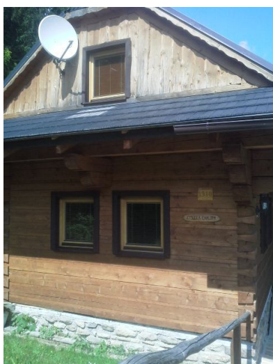
Obrázok 12 V Sudoparku