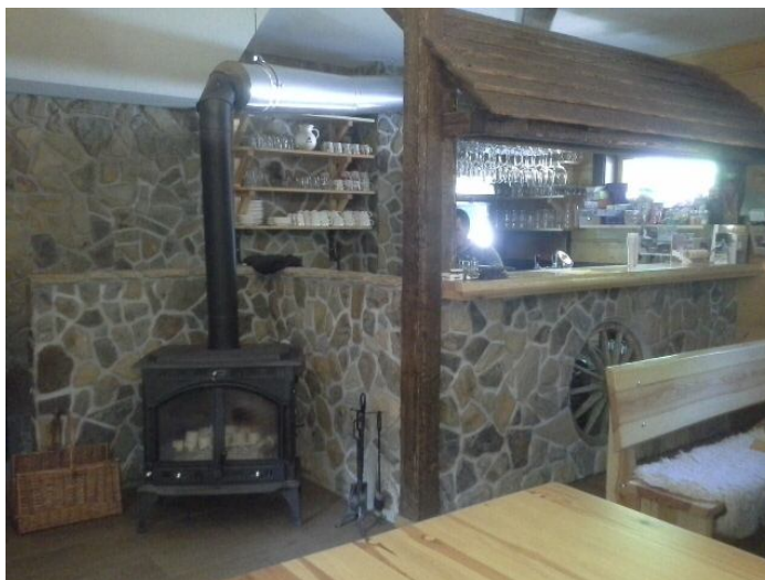
Obrázok 13 Reštaurácia v Sudoparku

➤ TIP: Ak máte záujem o odborný výklad v Sudoparku alebo jazdenie kontaktujte priamo majiteľa pána Radovana Jakuša na sudopark@sudopark.sk , 0915 558 811 alebo riaditeľku oblasťnej organizácie Kysuce Ing. Emíliu Sloviakovú na: riaditelka@regionkysuce.sk , 0948 339 264.