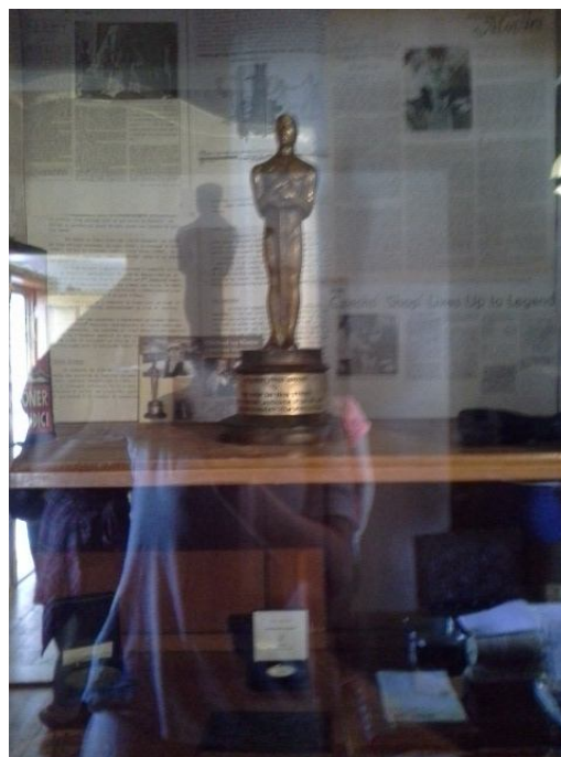
Obrázok 10 Soška Oscara