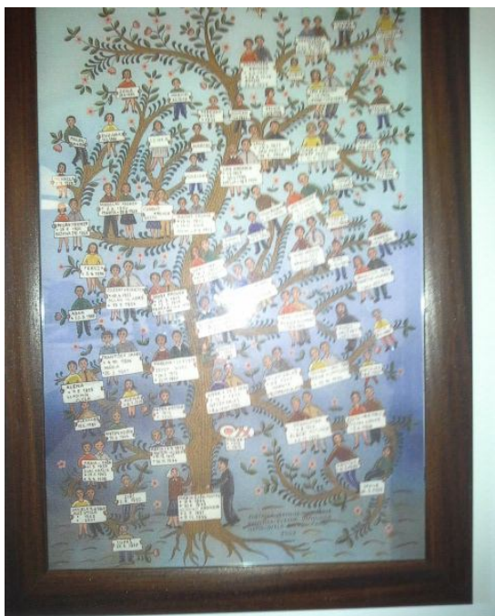
Obrázok 9 Rodokmeň J. Kronera