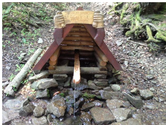
Obrázok 2 Pitná voda na trase