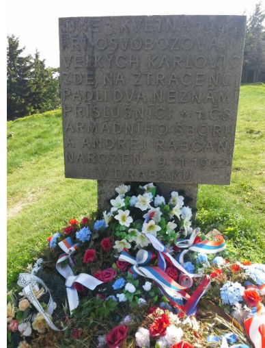
Obrázok 5 Pamätná tabuľa