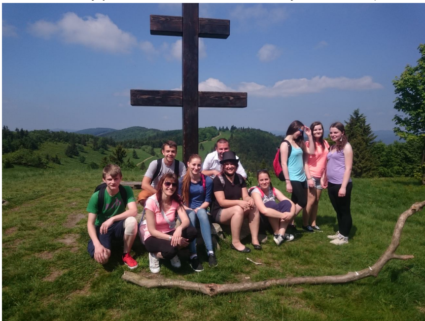
Obrázok 6 Z rozhľadne na Stratenci

Nachádza sa v katastrálnom území obce Makov, nad strediskom cestovného ruchu Makov-Kasárne. Je najvyšším vrcholom Javorníkov. Na jeho severozápadnom svahu leží najstaršia prírodná rezervácia na Kysuciach vyhlásená v roku 1967.