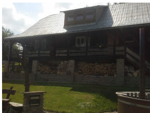
Obrázok 11 V Sudoparku

Sudopark je výsledkom snahy, ktorej cieľom bolo obnoviť pôvodnú osadu v Klokočove U Varmusov na funkčný areál pre rodiny s deťmi, obchodných cestujúcich na kratšie aj dlhšie pobyty. Obnova areálu začala v roku 2006 a dnes je k dispozícii zatiaľ prvá časť areálu. V areáli sa nachádzajú aj domčeky pôvodnej architektúry, ubytovať je možné sa v zrekonštruovaných dreveniciach; v tzv. sedliackom dome, meštiackom dome, v drevenici u studniara, kachliara ap. Veľkou atrakciou sú kúpacie sudy, ktoré majú liečebný účinok ako sauna, jazdenie na koňoch, vychádzky na kočoch alebo saniach ťahanými koňmi. Viac sa dozviete na videu a www.sudopark.sk . GPS súradnice: N 49.4716° E 18.58049°