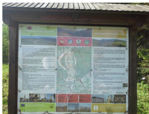
Obrázok 3 Informačná tabuľa na Stratenci